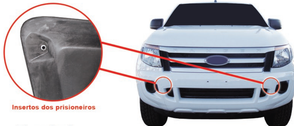
Insertos dos prisioneiros