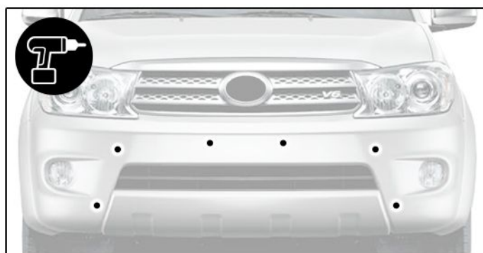
E) Depois de posicionar o overbumper, fazer a furação conforme locais marcados com tinta na etapa anterior.