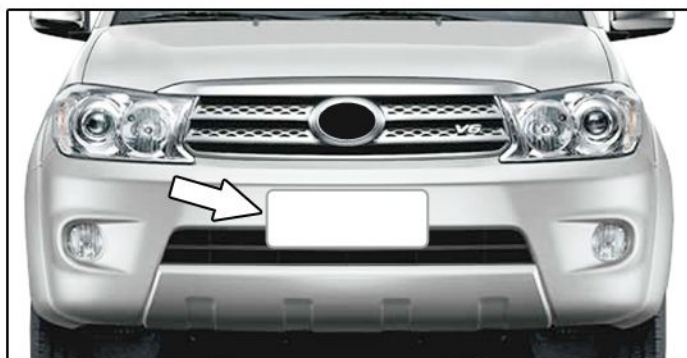
A) Retirar a placa dianteira do veículo.