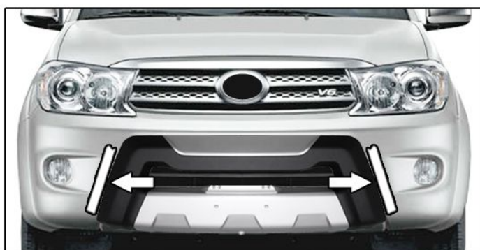
D) Posicionar o overbumper no para-choque do veículo alinhando-o conforme marcação da fita na etapa "B".