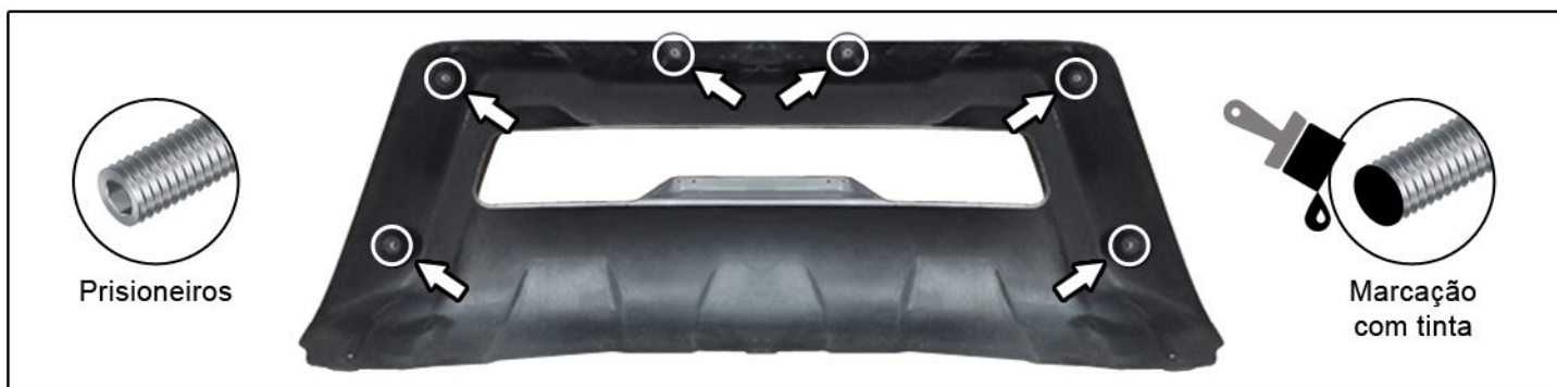
C) Inserir os 6 prisoneiros nos insertos da peça conforme locais indicados. Em seguida, fazer uma marcação com tinta na ponta dos prisoneiros (essa marcação serve p/ verificar os locais de furação do para-choque conforme etapa seguinte).